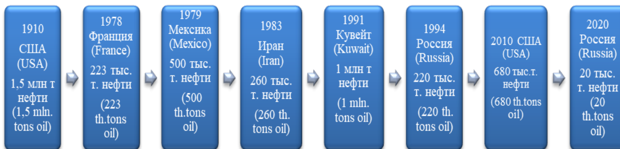
Рис. 1. Хронология масштабных разливов нефти в мире [составлено авторами] Fig. 1. Chronology of the largest oil spills in the world [compiled by the authors]

На рис. 1 приведена хронология крупнейших случаев разливов нефти.