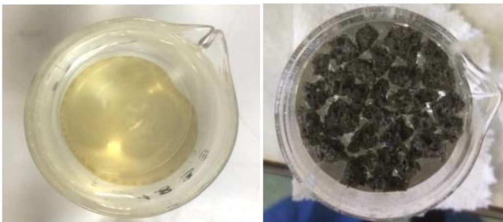
Рис. 2. Поглощение нефтяной пленки фосфатным сорбентом [32] Fig. 2. Absorption of oil film by phosphate sorbent [32]

Возвращаясь к аналогии с губкой, отметим, что обычные губки не могут удерживать заметные количества поглощённого вещества, в отличие от модифицированных. Модифицированные губки люфа, обработанные воском и графитом, получают в результате термической обработки, после чего достигается краевой угол смачивания до 158^\circ , тем самым проявляется супергидрофобность [33]. При низкой гидрофобности неорганические сорбенты часто тонут после поглощения и могут вторично загрязнять место разлива. Для решения этой проблемы фосфатные сорбенты обрабатывают гидрофобизаторами на основе кремнийорганических соединений, при этом нефтепоглощение обработанных материалов снижается почти в два раза. Однако такой сорбент может быть практически непотопляемым (более 40 дней). Супергидрофобным можно считать сорбент, который сохраняет свою плавучесть больше 72 часов. Сорбент, не обработанный гидрофобизатором, будет иметь лучшие характеристики по нефтепоглощению, но с большей долей вероятности он потонет через 6–9 часов.