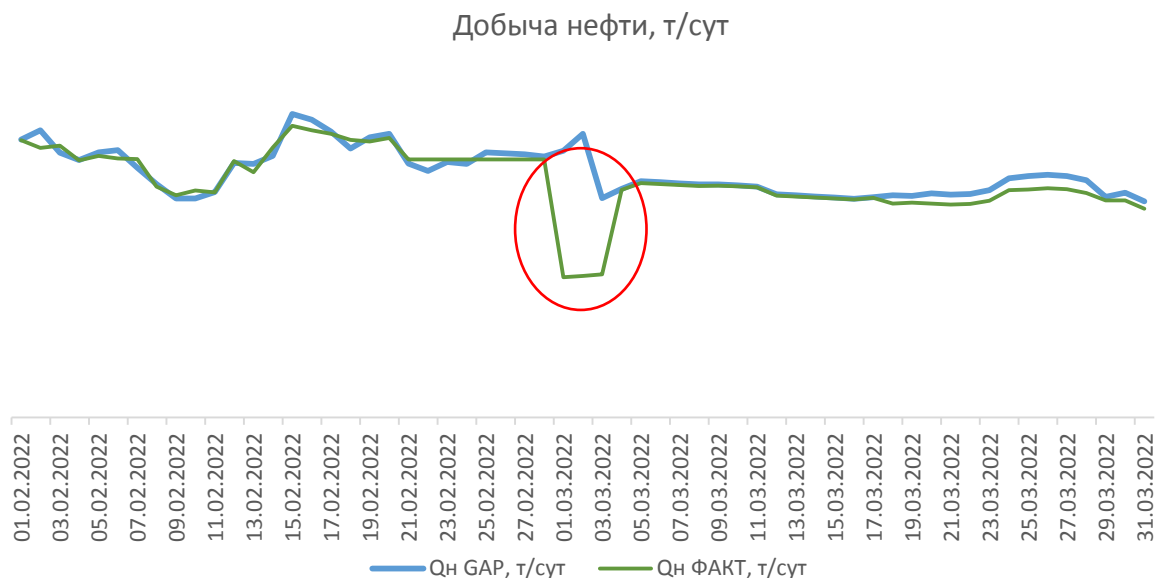
Рис. 3. Сравнение добычи нефти посуточно (GAP/ФАКТ) Fig. 3. Daily oil production comparison (GAP/FACT)