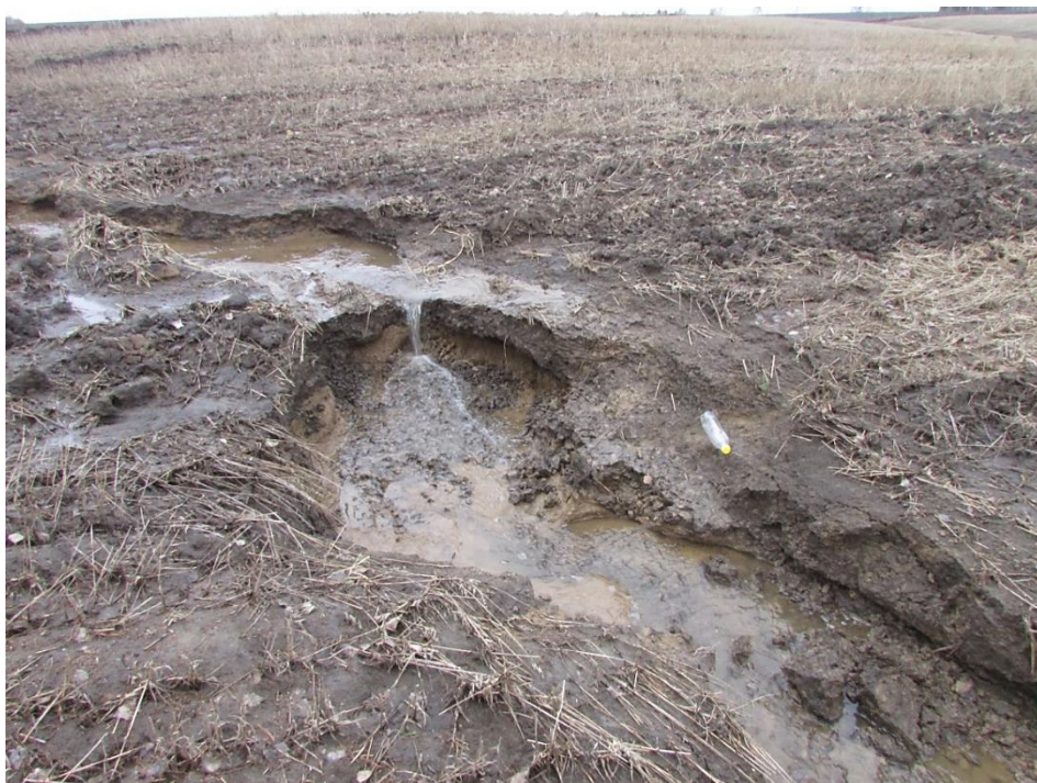
Рис. 3. Порожистое микрорусло на склоне пашни юго-востока Томской области (фото М.А. Каширо, апрель 2021)