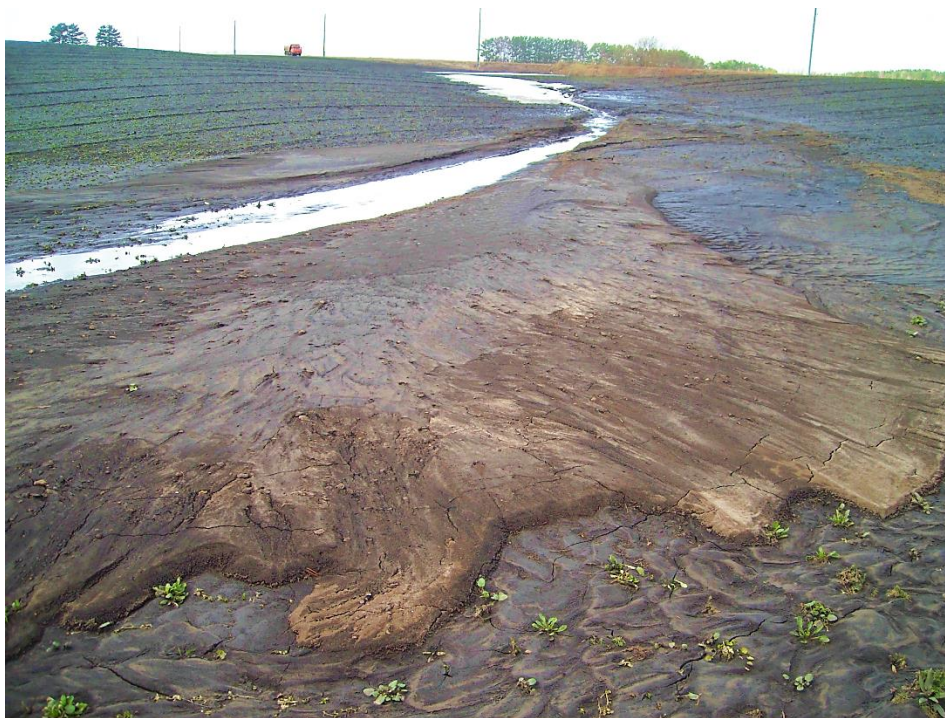
Рис. 4. Делювиальный шлейф на склоне агроландшафта Томского района (апрель 2012)