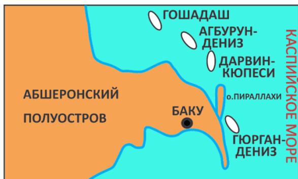
Рис. 1. Карта распределения локальных структур Северо-Абшеронского архипелага

полуострова, протянувшуюся в направлении с северо-запада на юго-восток. В эту зону входят складки: Гошадаш, Агбурун-дениз, Абшерон кюпеси, Шимали Абшерон, Генби Абшерон, Хезри, Гилавар, Арзу, Гелгюну, Вусал, Севиндж, Дан уддузу, Новханы, Айпара, Генджлик, Эшрефи, Гелебе, Зирве, Хамдам, Гарабаг (рис. 1) [2, 3].