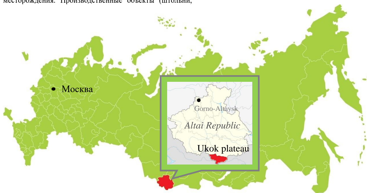
Рис. 1. Расположение района исследований на территории Российской Федерации

Содержание металлов в почвах определяли в Институте геологии и минералогии СО РАН методом эмиссионного спектрального анализа. Проанализировано 143 почвенных образца. Общее содержание микроэлементов в природных водах определено в Институте водных и экологических проблем СО РАН на приборе SOLAAR M-6 спектрометрическим методом с использованием электротермической атомизации.